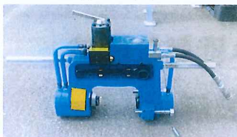
レールスエージャー