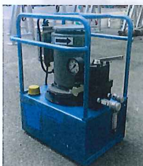
レールスエージャー用電圧ポンプ 油圧ホース付