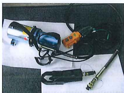
カラーカッター及び カラーカッター用油圧ポンプ