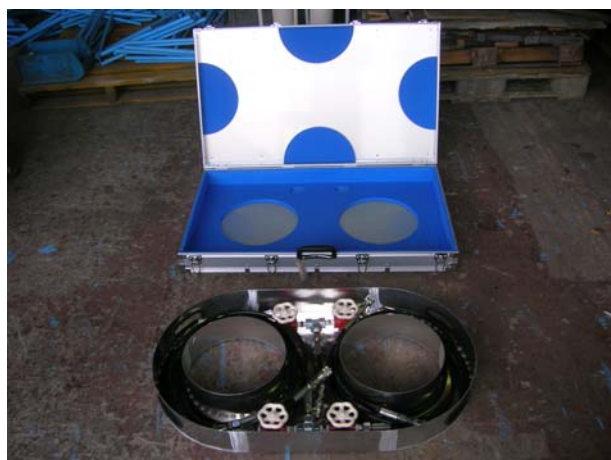
アルミトランク内にアルミケースを収納