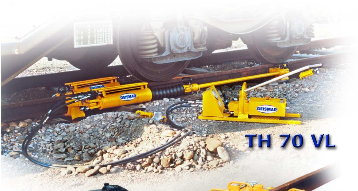
TH 70 VL