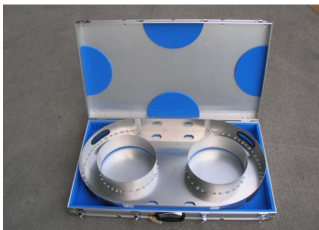
全体（アルミトランク・アルミケース）