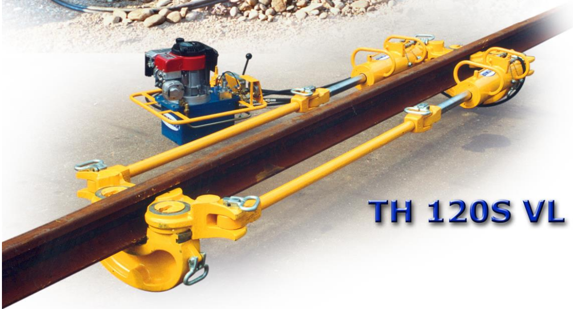
TH 120S VL